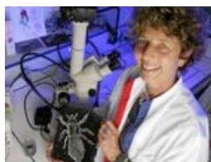
Catherine Combescot, Docteur ès sciences parasitologue spécialisée dans la lutte contre les poux. Université Paris-Sud 11.